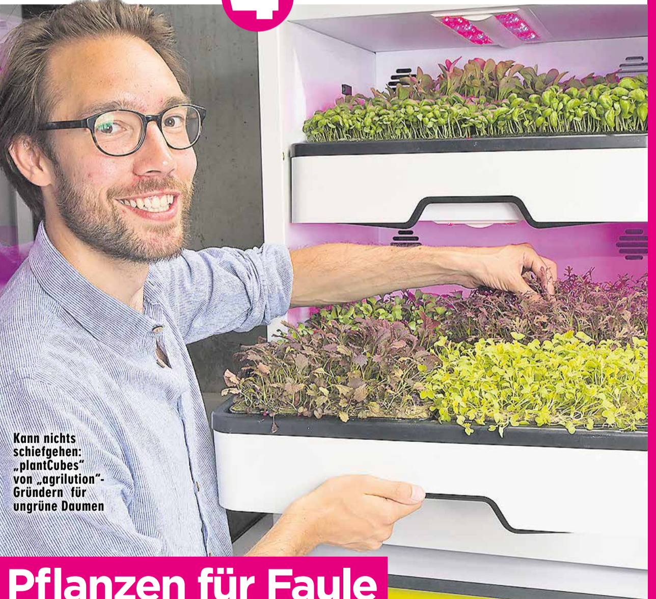
Kann nichts schiefehen: „plantCubes“ von „agrilution“-Gründern für ungrüne Damen