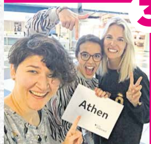
Überraschungsreisen durch Europa: Für diese Mädels geht es nach Athen